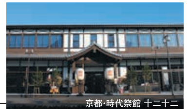
京都・時代祭館 十二二